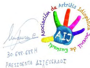
30.688.688 H PRESIDENTA AIJEUSKADI